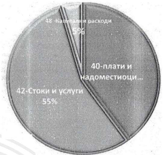
Grafiku 2. Realizimi i Buxhetit për vitin 2025 sipas zërave

Të dhënat e paraqitura tregojnë se pjesa më e madhe e Buxhetit, përkatësisht 55% e Buxhetit të përgjithshëm, u realizua në zërin 42 – Mallra dhe shërbime, nga të cilat shumica e mjeteve u përdorën për akomodim dhe për zbatimin e kompetencave ligjore të ATO-së për mirëmbajtjen e pajisjeve dhe aparateve të ndërmjetësimit me qëllim krijimin e kushteve për zbatimin e masave për ndjekjen e komunikimeve.